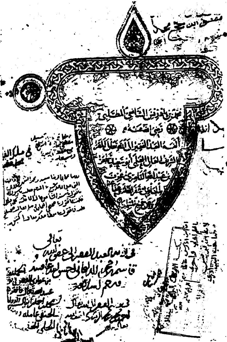
طرة الكتاب وتظهر فيها التملكات وعنوان الكتاب